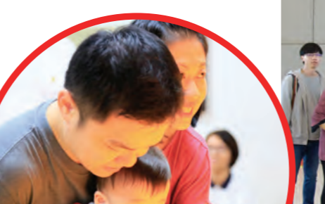
▲闔家大手牽小手，到寶雲寺浴佛、品茶、禮觀音，祝福媽媽幸福快樂。