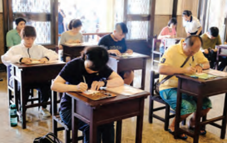
▲紫雲寺浴佛法會後，民眾專注鈔經，為自己和家人祈福。