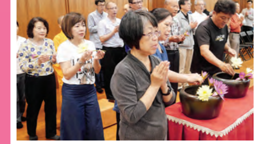
▲蘭陽分院浴佛法會，大眾虔誠以鮮花供佛，為家人祈福。