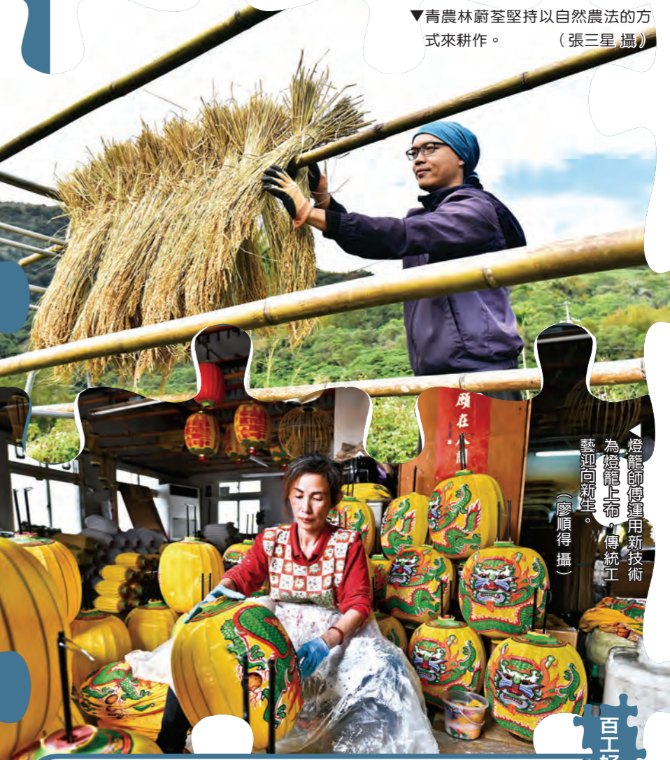
燈籠師傅運用新技術，為傳統上布、傳統工藝，向新生。

「百工好願」網站： https://do.dharma.org.tw/pro/index.html