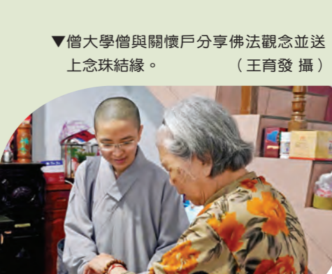
▼僧大學僧與關懷戶分享佛法觀念並送上念珠結緣。

有序；另一位則喜歡到廟宇中與人互動、互相關懷。「儘管環境不佳，卻看見菩薩如何從中找到出路。」還有越南籍法師，遇到從越南嫁來臺灣二十年的媳婦，兩人以家鄉話聊到孩子時，看到她眼中閃爍的光芒。