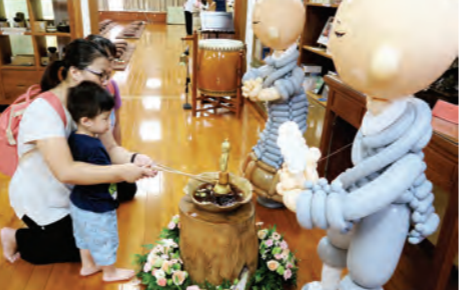
▲媽媽帶著家中小朋友到臺南分院歡喜浴佛，學習佛陀的悲智。