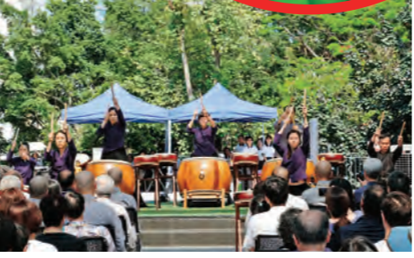
▲香港道場於戶外廣場慶祝佛誕節，以各式特色佛教活動吸引大眾。