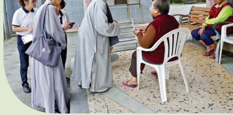
▲僧大學僧與義工至新北市萬里區慰訪關懷戶。

兩次家訪共計探訪十八戶家庭。因長期照顧臥病妻子，無心打理居家環境的菩薩，得知法師要來，特意將家中整理一番並剪了頭髮。探訪的法師表示，一開始覺得不太自然，但換一個角度想，若能藉這個機會讓對方提起心力打掃環境，不僅對健康好，也可轉化心境。因生病而雙腳難行，常坐輪椅的菩薩，可以一個人輕鬆越過門檻進出大門，並順手將輪椅抬進抬出。原本是高車馬路隊長，三十多年前因車禍而神經受損，難以控制肌肉，在大家的鼓勵下拿起筆來簽下大名。「希望讓他們看見自己『可以』的部分。」郭又禎分享。