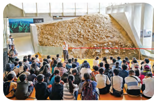
▲受助學子參訪九二一大地震教育園區，感念當年受苦受難的菩薩，祈願人人免難有幸福。

各地分院與辦事處精心規畫體驗活動，將四種環境融入活動中，學生與家人相敬放鬆之餘，留下寓教於樂的回憶。四月二十一日，士林、社子、中山區受助學子造訪「芝山文化生態綠園」，同學沿途淨山，力行愛護地球；四月二十七日，信行寺舉辦臺東地區頒發活