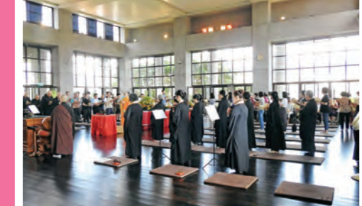
▲信行寺法師帶領二百餘位信眾以法會共沐佛恩。