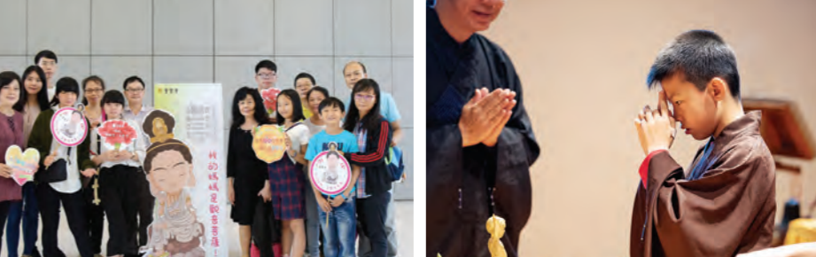
▲舊金山道場慶祝佛誕節，小菩薩向悉達多太子恭敬問訊。