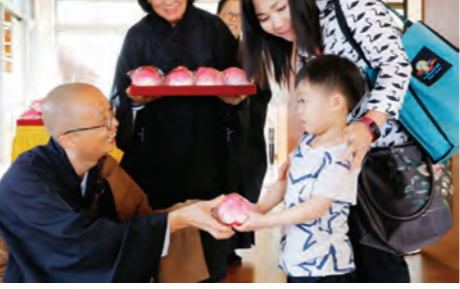
▲闔家到天南寺參加浴佛法會，小菩薩歡喜接受法師致贈的壽桃與祝福。