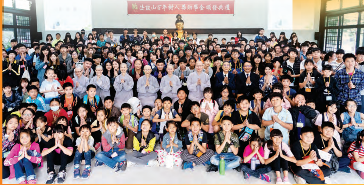
▲中部地區聯合頒發百年樹人獎助學金，受助學子與家長們齊聚感謝法鼓山的關懷。