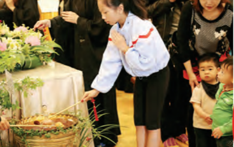
▲浴佛節當天，溫哥華許多華人家庭帶著小菩薩至道場同慶法喜。