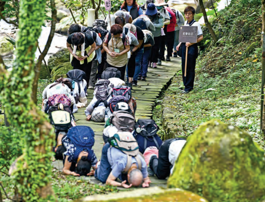
▲從清晨七點起，各地信眾分別沿法鼓山園區臨溪朝山步道、藥師古佛迴環步道、法華公園朝山步道，以三步一拜禮敬朝山。