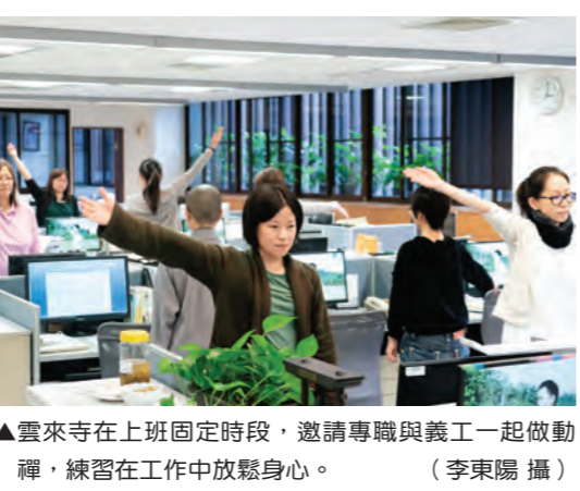
▲雲來寺在上班固定時段，邀請專職與義工一起做動禪，練習在工作中放鬆身心。

【本刊訊】引警聲響，「請大家將身體動一動，準備下坐，一起來體驗動禪。」廣播系統傳來親切的聲音，電腦同步切換成動禪示範畫面，平日繁忙的辦公室，頓時寂靜，大眾聽著引導，享受一起做動禪的放鬆與安定。這是自三月十八日起，北投雲來寺各樓層辦公室的日常。